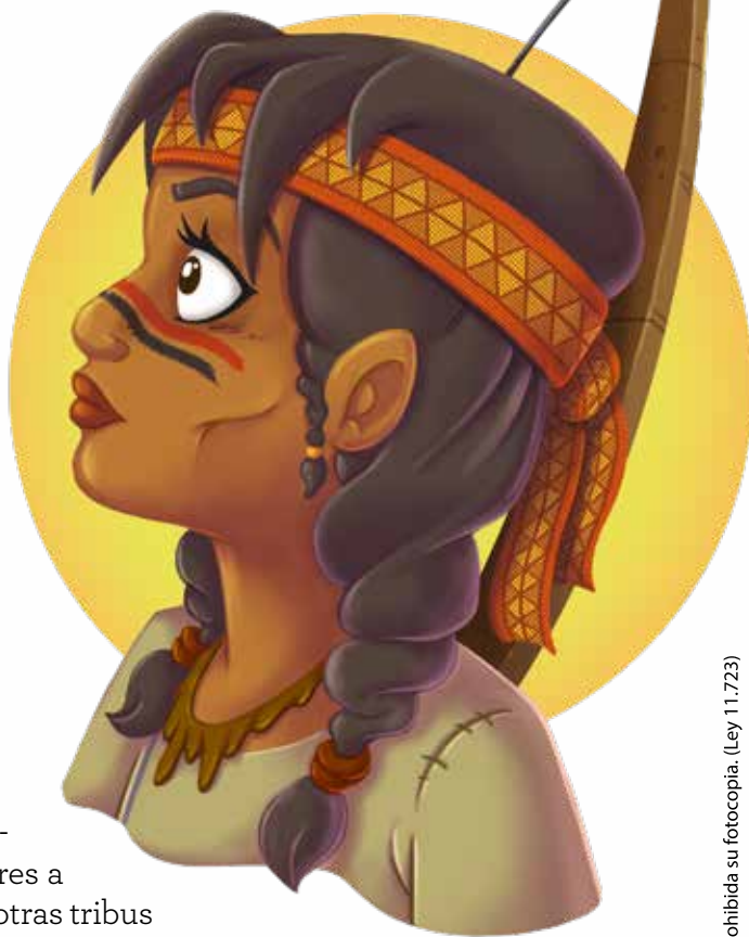
Kapelusz editora S.A. Prohibida su fotocopia. (Ley 11.723)

La leyenda cuenta que, aunque su cuerpo cayó en el combate, su alma sigue viva desde entonces. Dicen que habita en el vuelo majestuoso del águila y que, por eso, el ave es símbolo de libertad y hermandad entre los pueblos.